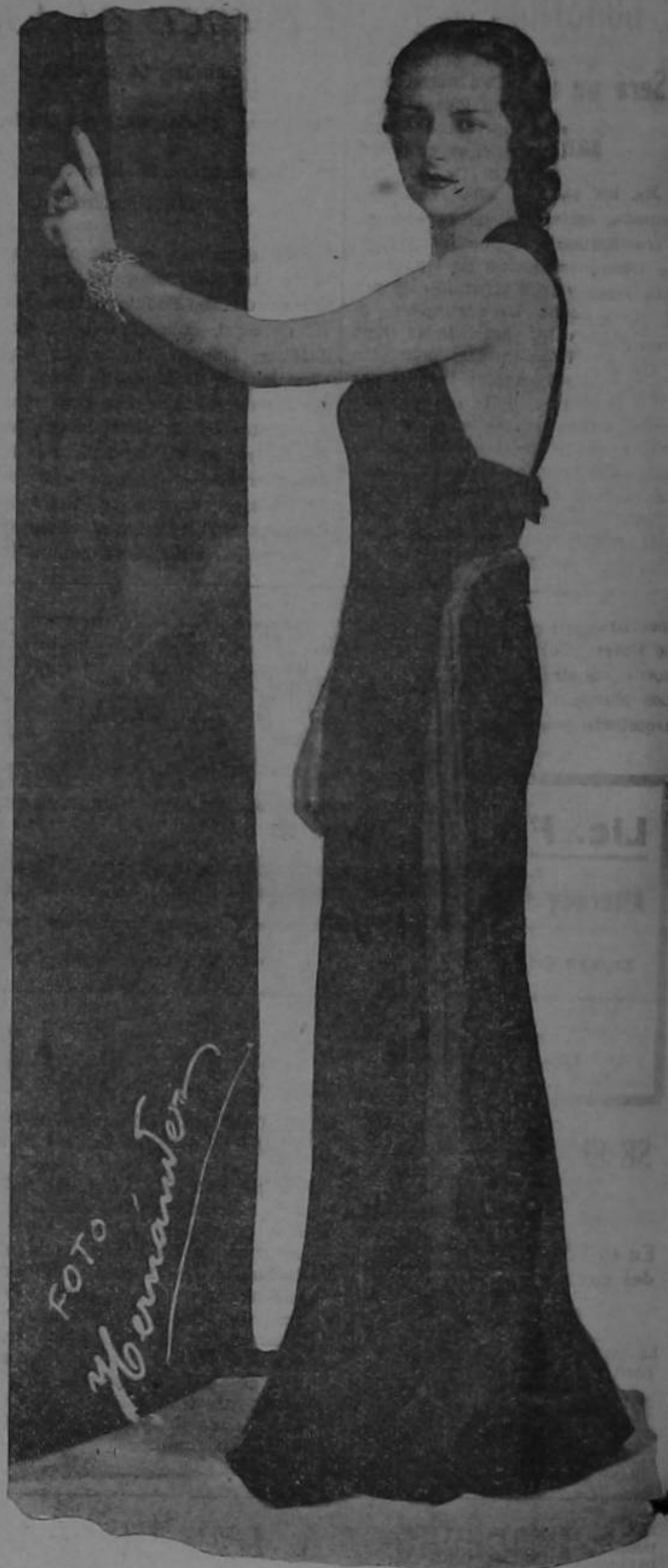
Una de las bellas Caudidatas, al honroso título de SEÑORITA COSTA RICA