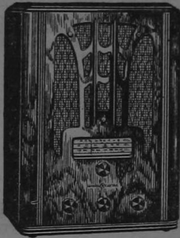
RADIO G. E. MODELO E-81

La rara belleza de sus muebles constituye la nota característica de la serie 1936-1937 de radios General Electric, debida al genio creador del propio estilista de la G. E., uno de los dibujantes industriales de más renombre en los Estados Unidos.